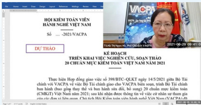
Bà Hà Thị Ngọc Hà - Phó Chủ tịch phụ trách chuyên môn VACPA – Chủ trì phát biểu khai mạc cuộc họp

Theo kế hoạch, năm 2021, Ban nghiên cứu, soạn thảo CMKIT sẽ nghiên cứu, soạn thảo 20 CMKIT và trình Bộ Tài chính thuộc các nhóm chuẩn mực: (i) Nhóm Chuẩn mực kiểm toán 200 - 299 (nguyên tắc và trách nhiệm chung); (ii) Nhóm Chuẩn mực kiểm toán 300 - 499 (đánh giá rủi ro và biện pháp xử lý đối với rủi ro đã đánh giá); (iii) Nhóm Chuẩn mực kiểm toán 500 - 599 (bằng chứng kiểm toán); (iv) Nhóm Chuẩn mực kiểm toán 600 - 699 (sử dụng công việc của các bên khác).