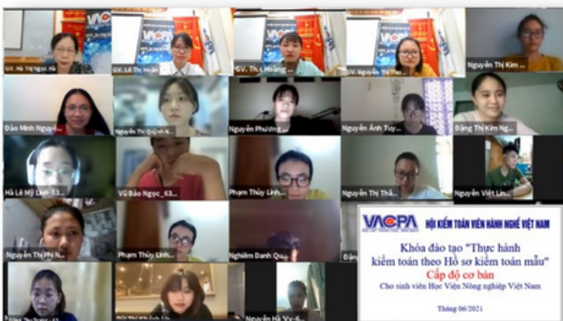
Hình ảnh các học viên khóa đào tạo

Trong thời gian tới, VACPA sẽ tiếp tục mở các khóa đào tạo thực hành cho trợ lý kiểm toán và sinh viên năm thứ 3, thứ 4 chuyên ngành kế toán, kiểm toán với phần nội dung chương trình linh hoạt để phù hợp với đặc trưng, tính chất riêng của từng trường Đại học, từng đơn vị. VACPA tin tưởng rằng các lớp học thực hành cho các trợ lý, các sinh viên sẽ cung cấp nhiều kiến thức, kỹ năng bổ ích để hỗ trợ quá trình công tác của các bạn tại doanh nghiệp kiểm toán cũng như quá trình ứng tuyển vào các công ty kiểm toán nói riêng và sự phát triển của các doanh nghiệp kiểm toán, ngành kiểm toán độc lập tại Việt Nam nói chung.